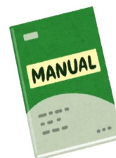
(図解)簡易マニュアル

注1) 当研修会参加には、Coubicアカウントの作成またはFacebookアカウントでのログインが必要です。